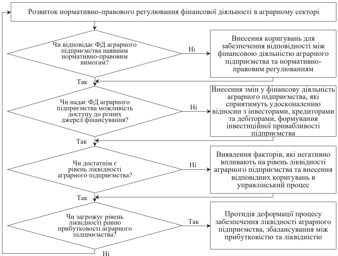
Рис. 3. Структурно-логічна послідовність управління розвитком фінансової діяльності аграрних підприємств

Висновки. Обґрунтовано, що завдання управління розвитком фінансової діяльності підприємства тваринництва постійно змінюються, тому їх необхідно визначати відповідно до стадії розвитку та специфічних характеристик кожного окремого підприємства. Зазначено, що формування завдань повинно спиратися на такі принципи: безперервності, послідовності, поступовості, неоднаковості