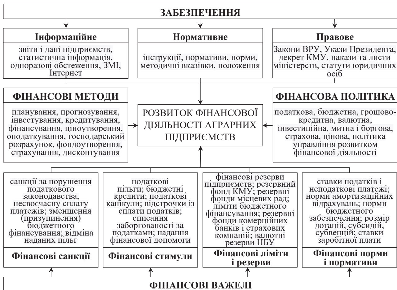
Рис. 1. Управління розвитком фінансової діяльності аграрних підприємств на основі традиційного підходу