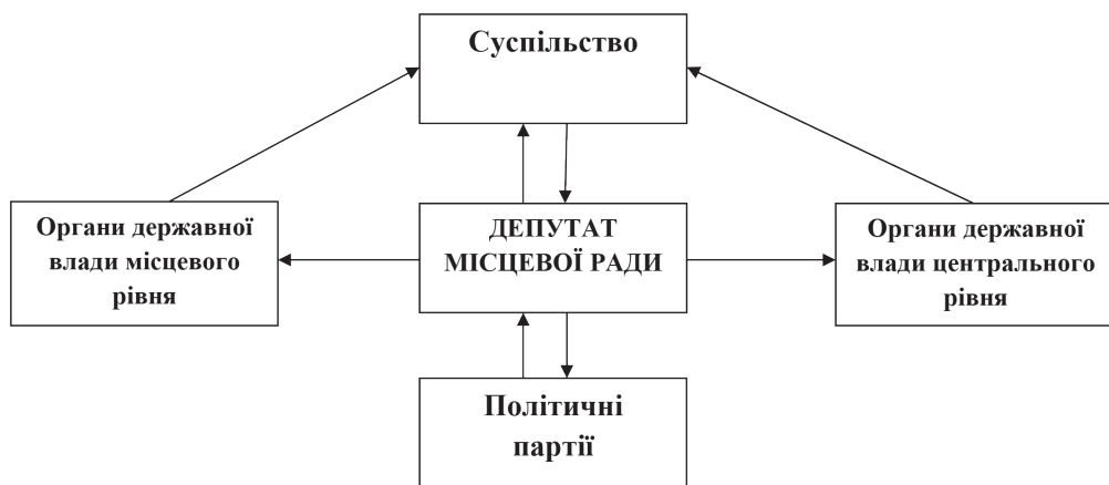
Рис. 2. Схема взаємодії депутата місцевої ради з іншими суб’єктами в напрямі реалізації його функцій

ють не лише органи місцевого самоврядування, органи виконавчої влади місцевого рівня, центральні органи влади, але і суспільство. Тому в межах нашого дослідження варто зосередити увагу на принципових особливостях взаємодії, що виникає між депутатом місцевої ради і суспільством, органами виконавчої влади місцевого рівня, органами центральної влади з метою узгодження і реалізація інтересів індивіда, соціальних груп, суспільства і держави; розробки і реалізація рішень щодо попередження криз і конфліктів. Схематично взаємодію між депутатами місцевої ради і суспільством, органами виконавчої влади місцевого рівня, органами центральної влади відображено на Рисунку 2.