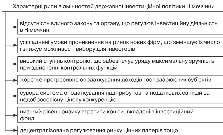
Рис. 3. Характерні риси відмінностей державної інвестиційної політики Німеччини

панії. У зв'язку з встановленим пільговим регулюванням внаормовано також розмежування між прямими та іншими іноземними капіталовкладеннями.