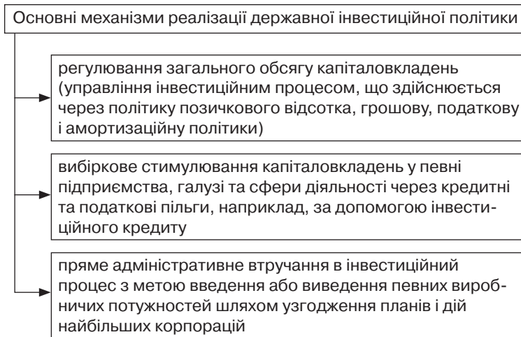
Рис. 1. Основні механізми реалізації державної інвестиційної політики Великобританії, Франції та Німеччини