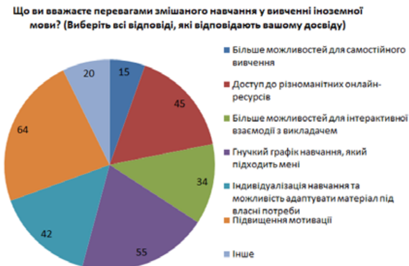
Рис. 2. Відповіді респондентів