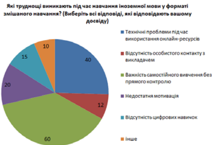
Рис. 3. Відповіді респондентів

ональному університеті імені І.І. Мечникова та Київському національному університеті імені Тараса Шевченка, проаналізувати переваги та ризики, з якими зіштовхуються здобувачі освіти.