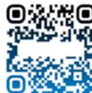
Рис. 1. Використання QR-кодів при вивченні іноземної мови у процесі змішаного навчання

Home task: Scan QR-code and do the task.