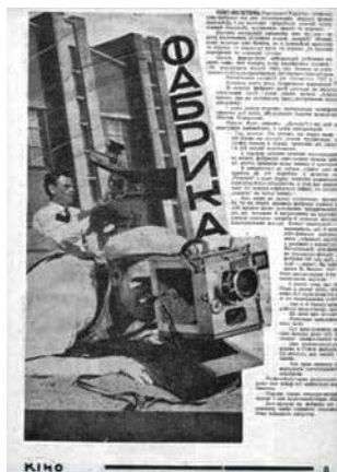
Ілюстрація 11. Фотоколаж 1 до статті Г. Лазаренка «Фабрика працює»

У №9–10 журналу «Кіно» розміщено два фотоколажі, які є візуальним супроводом розміщеної на розвороті статті Г. Лазаренка «Фабрика працює» [6], де автор висвітлює переваги й недоліки роботи Київської кінофабрики. Важливим досягненням Г. Лазаренко вважає використання на Київській кінофабриці кіноплівки, яку виготовляли в Шостці та Переяславі. Саме це зумовило акцентування уваги у фотоколажах на кінокамерах і кіноплівці радянського виробництва. Наприклад, у першому фотоколажі [12], що корелює зі статтею «Фабрика працює», на тлі споруди фабрики зафіксовано двох кінооператорів (див. ілюстрацію 11), які працюють зі своїми кінокамерами.