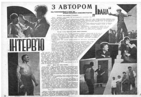
Ілюстрація 8. Фотоколаж фільму «Іван»

У № 9–10 журналу «Кіно» за 1932 рік на обкладинці розміщено фотоколаж [14] із 9 прямокутних фотографій у формі кіноплівки. На цих фотографіях були зафіксовані епізоди звукової кінохроніки «Приїзд т.т. Молотова і Кагановича на III Всеукраїнську партконференцію», виробником якого була Всеукраїнська фабрика кіно-хроніки та агітмасових фільмів. Цю інформацію, що, на нашу думку, виконує функцію текстівки [10], розміщено на другій сторінці обкладинки. Припускаємо, що таке розмі-