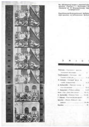
Ілюстрація 10. Фотоколаж епізодів із фільму «Приїзд т.т. Молотова і Кагановича на III Всеукраїнську партконференцію»

Прикметним є те, що 3 фотографії згори фіксують однаковий епізод кінохроніки, 4-та фотографія згори несуттєво відрізняється від попередніх (рука політика не пригнута до тіла, а відведена від тіла трохи вбік), 2 фотографії знизу теж фіксують однаковий епізод кінохроніки. Вважаємо, що прийом повторення епізодів на фотографіях було використано для акцентування уваги читача на важливих епізодах кінохроніки.