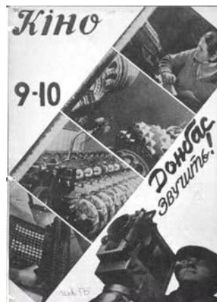
Ілюстрація 3. Донбас звучить! Фотоколаж

На фотоколажі [2], що виконує інформаційно-рекламну й пропагандистську функцію, одна фотографія (див. ілюстрацію 3) із чотирьох фотографій, на одній стороні яких видно звукову доріжку, є фотографією епізоду фільму «Ентузіазм: Симфонія Донбасу», де зафіксовано процес індустріалізації. Ідеться про фотографію, на якій зображено бані церков, які потім у документальному фільмі в результаті антирелігійного мітингу перетворюють на клуб, попередньо збивши з них хрести. Епізоди фільму, зафіксовані на трьох інших фотографіях зі звуковою доріжкою, наявність якої підкреслює важливість звукового супроводу, ми не змогли знайти в документальному фільмі під час перегляду. Припускаємо, що зафіксовані на вищезазначених фотографіях епізоди фільму були робочими матеріалами, які з невідомих нам причин не стали його частиною. Епізод на силуетній фотографії, де зображено оператора і яка розміщена поруч із фотографіями зі звуковою доріжкою, теж відсутній у документальному фільмі [3].