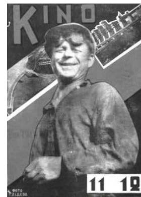
Ілюстрація 6. Фотоколаж з усміхненим робітником на індустріальному тлі

У №11–12 журналу «Кіно» за 1931 рік на обкладинці зображено фотоколаж, де на тлі індустріального пейзажу стоїть усміхнений робітник [17]. На обкладинці білими літерами на чорному тлі зазначено автора фотографій – Глідера. Вербальний супровід, який би дав читачеві більшу інформацію про суть зображеного, відсутній. Цей фотоколаж (див. ілюстрацію 6) виконував пропагандистську функцію з огляду на процеси індустріалізації, що відбувалися в країні. Позитивна емоція робітника, який став уособленням усього робітничого класу, сугестувала реципієнтам думку про те, що робітники задоволені процесом індустріалізації та її результатами.