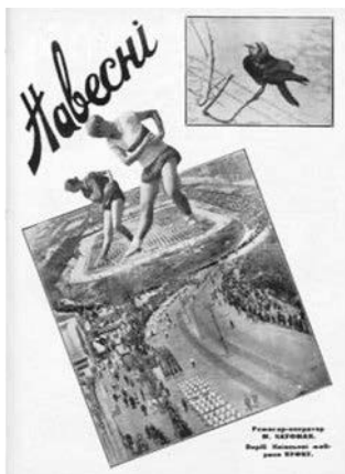
Ілюстрація 2. Фотоколаж фільму «Навесні» з вербальним супроводом

Для створення фотоколажу [26] використано дві прямокутні (на одній прямокутній фотографії зображено пташку, на другій – великий стадіон та ходу спортсменів) та дві гіперболізовані силуетні фотографії спортсменок, розміщені на прямокутній фотографії, де зображено стадіон. Цей фотоколаж, на нашу думку, виконує як інформаційно-рекламну, так і пропагандистську функцію, пов'язану з популяризацією спорту, зокрема покращенням фізичної підготовки, яка була актуальна на тлі загрози початку війни. Гіперболізовані образи спортсменок, привертаючи увагу реципієнтів, підкреслювали важливість розвитку спортивної сфери. Фотоколаж фільму (див. ілюстрацію 2) має вербальний, оформлений жирним накресленням супровід: назву фільму, оформлену рукописним шрифтом, інформацію про місце виробництва фільму («Виріб Київської фабрики ВУФКУ» [26]), прізвище режисера-оператора фільму («Режисер-оператор М. Кауфман» [26]).