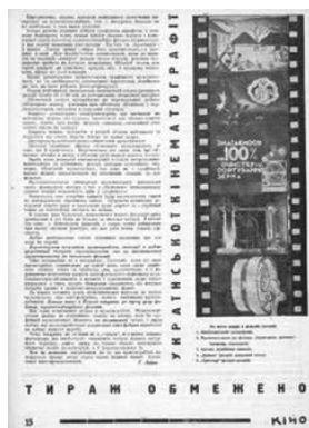
Ілюстрація 14. Фотоколаж із вербальним супроводом до статті «Фабрика неймовірного»

У №17–18 журналу газети «Кіно» за 1932 рік на обкладинці розміщено фотоколаж фільму «Люлі-люлі, дитино» (1932), знятого режисером Л. Френкелем, оператором Вовченком за сценарієм О. Варавви [8]. У фільмі йшлося про «організацію піонерських загонів в українській прикордонній смузі» [8]. За твердженням Бети, це «фільм про революційну боротьбу на Західній Україні та участь у них піонерів» [1]. На фотоколажі [25], що виконував інформаційно-рекламну та пропагандистську функції, центральною фотографією (див. ілюстрацію 14) є фотографія епізоду збору дітей, які брали участь у революційній боротьбі, праворуч угорі розміщено силуетну фотографію хлопчика, унизу ліворуч – фотографію жандарма. Таке розміщення фотографій, на нашу думку, може мати символічне значення. Так, розміщення фотографій образів хлопчика та жандарма можуть презентувати міфологічну бінарну