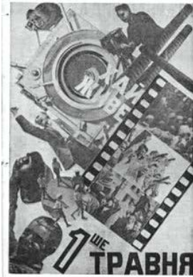
Ілюстрація 4. Фотоколаж присвячений 1-му травня

щоб підкреслити масштабність святкування 1-го травня, його всеохопність від дітей до дорослих – представників різних професій. Для оформлення вербального супроводу було використано контраст кольорів «білий-чорний», хоча, на нашу думку, використання білого кольору зменшує рівень читабельності.