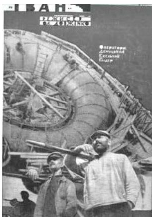
Ілюстрація 17. Фотоколаж фільму «Іван»

У цьому ж номері журналу на останній сторінці обкладинки розміщено фотоколаж вищезазначеного фільму. Концепція цього фотоколажу (див. ілюстрацію 16), що виконує інформаційно-рекламну й пропагандистську функції, схожа з концепцією попереднього фотоколажу: на тлі будівництва розміщено силуетні фотографії робітників. Зазначимо, що під час перегляду фільму «Іван» ми не помітили в ньому цих кадрів. Припускаємо, що для створення фотоколажу були використані робочі кадри вищезазначеного фільму. Вербальний супровід містить прізвища операторів («Оператори: Демуцький Екельчик Глідер» [24]), оформлених шрифтом білого кольору, назву фільму, ініціали та прізвище режисера, оформлених шрифтом чорного кольору на білому тлі.