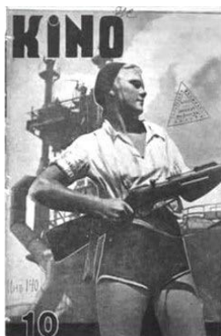
Ілюстрація 5. Фотоколаж з озброєною жінкою на індустріальному тлі

1931 року в журналі «Кіно» було надруковано 2 фотоколажі. У № 10 журналу «Кіно» за 1931 рік на обкладинці розміщено фотоколаж [16], де на тлі індустріального пейзажу є силуетна фотографія жінки, яка тримає в руках рушницю. Поява мілітаризованого образу жінки, готової взяти до рук зброю, на фотографії з огляду на поступову розбудову армії для захисту від зовнішніх ворогів була одним із засобів мілітаризації тогочасної суспільної свідомості. Образ індустріального пейзажу сугестував реципієнтам думку про те, що індустріалізація сприятиме підвищенню рівня мілітаризації, зумовленої подіями в міжнародному дискурсі. Виконуючи пропагандистську функцію, вищезазначений фотоколаж завдяки використаній образній системі не тільки утверджував у реципієнтів думку про необхідність проведення форсованої індустріалізації, а й морально готував їх до різних варіантів розгортання подій.