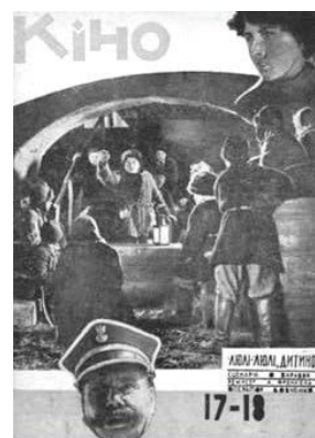
Ілюстрація 15. Фотоколаж фільму «Люлі-люлі, дитино» з вербальним супроводом

опозицію «верх-низ», що відповідає бінарній опозиції «добро – зло». З огляду на це фотографію, розміщену посередині, відповідно до міфологічної концепції можна вважати середнім світом, де відбувається боротьба між добром і злом. У вербальному супроводі, що оформлений за принципом кольорового контрасту (шрифт чорного кольору на білому тлі), зазначено ініціали та прізвища сценариста, режисера, оператора. У ньому є відмежування вищезазначених складових візуального супроводу тонкою горизонтальною чорною лінією.