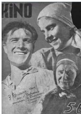
Ілюстрація 7. Фотоколаж фільму «Іван»

фільму «Іван» наголошував на необхідності систематичного зв'язку між «продюцентом кіно-продукції та її споживачем» [4], розвитку пролетарського мистецтва, презентації нового образу робітника – робітника, який керує машинами. Також О. Довженко наголосив, що для нього ще одним випробуванням стало поєднання у фільмі «Іван» образу зі звуком. На фотоколажі фільму «Іван», що є візуальним супроводом вищезазначеного монологічного інтерв'ю, зображено епізоди фільму «Іван», а також О. Довженка – режисера цього фільму. Припускаємо, що у фотоколажі фільму було використано робочі матеріали, оскільки деякі епізоди, зафіксовані на фотографіях, у фільмі [11] не знайшли.