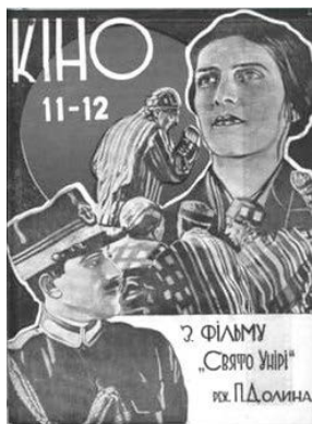
Ілюстрація 13. Фотоколаж фільму «Свято Унірі»

5. «Трактор» (розріз деталі)» [18]. Вищезазначений фотоколаж виконує як інформаційно-рекламну й пропагандистську функції, так і функцію візуального супроводу статті «Фабрика неймовірного».