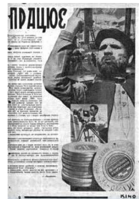
Ілюстрація 12. Фотоколаж 2 до статті Г. Лазаренка «Фабрика працює»

На другому фотоколажі [13] до статті Г. Лазаренка «Фабрика працює» розміщено фотографії (див. ілюстрацію 12) із зображенням плівки радянського виробництва, оператора за роботою з кінокамерою, павільйон кінофабрики, чоловіка з піднятою вгору рукою й вказівним пальцем. Цим жестом автор фотоколажу підкреслює важливість виготовлення радянської кіноплівки, що означало ліквідацію залежності від закордонного виробника.