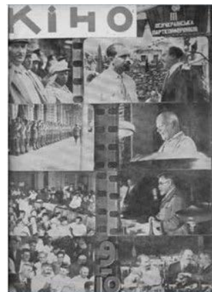
Ілюстрація 9. Фотоколаж епізодів із фільму «Приїзд т.т. Молотова і Кагановича на III Всеукраїнську партконференцію»

щення текстівки було зумовлено як концептуальною причиною – прагненням надати читачеві якомога більше візуальної інформації про III Всеукраїнську партконференцію, так і необхідністю дотримуватися політичної коректності завдяки уникненню записів на фотографіях із вищезазначеною подією. Про це свідчить розміщення назви журналу та його номерів на тих частинах обкладинки, де зображень епізодів звукової кінохроніки «Приїзд т.т. Молотова і Кагановича на III Всеукраїнську партконференцію» немає. На фотоколажі (див. ілюстрацію 9), що виконує пропагандистську функцію, зафіксовано кадри з фільму, які увиразнюють масштабність вищезазначеного заходу й презентують лідерів. Прикметним є те, що епізоди, які ілюструють масовість, розміщено напроти фотографій, де акцент зроблено на тогочасних політичних лідерах, таким чином створюючи ефект виступу лідерів перед учасниками III Всеукраїнської партконференції. Розміщена угорі фотографія із записом «III всеукраїнська партконференція» [14] одразу орієнтує читача щодо події, зображеної на першій сторінці обкладинки.