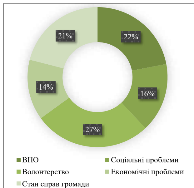
Рис. 2. Результати аналізу новинного контенту телерадіокомпанії РАІ (за період 01.01.2023 – 31.12.2023), %

Кількісний аналіз новинних сюжетів телерадіокомпанії РАІ впродовж 2023 року продемонстрував пріоритетність висвітлення соціальної проблематики краю. Це свідчить про те, що регіональне медіа, попри помітне розширення географії новин, все ще оперативно й детально інформує громаду про зміни в житті Івано-Франківська та області (рис. 2).