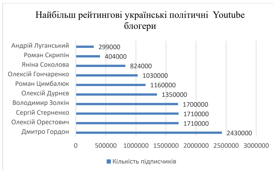
Рис. 2. Найбільш рейтингові українські політичні Youtube блогери