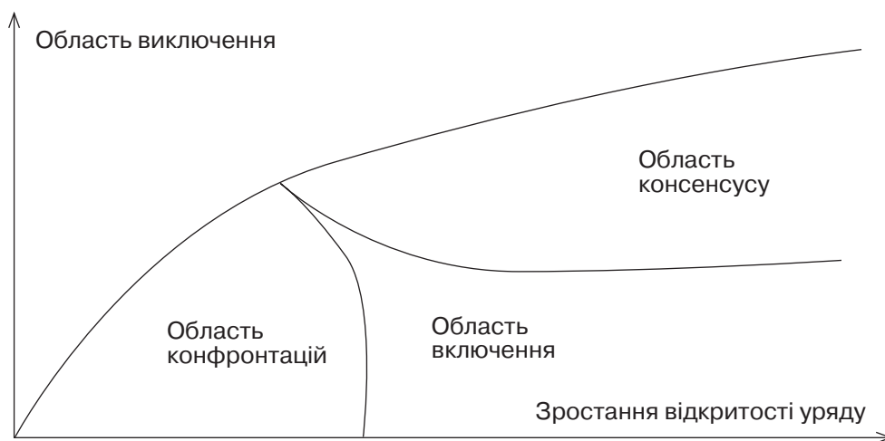
Рис. 1. Секторальний поділ участі громадян в управлінській діяльності

Між сектором консенсусу та сектором конфронтації, на думку Дж. Еббота, розташована область залучення (рис. 1). Як бачимо, спілкування з громадою через підпорядковану урядову систему призводить до чергової революції (див. рис. 2). Це саме стосується діалогових форумів, секторних комісій, ad-hoc зустрічей. Тобто підміна реальних інструментів безпосереднього управління піар-інструментами, консультативними заходами необов'язкового врахування в управлінні не вирішує проблематики локального урядування.