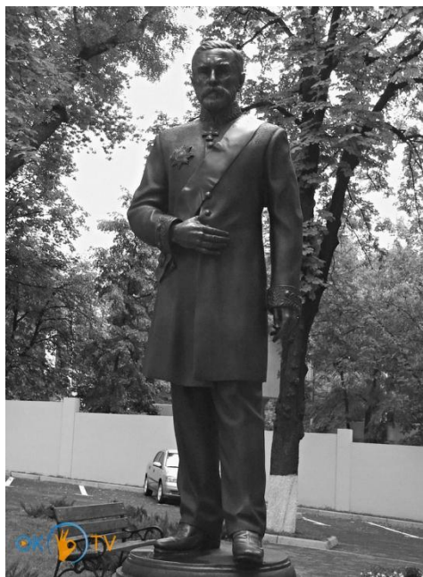
Рис. 2. Пам'ятник М. Терещенку на території лікарні Охматдит в м. Києві