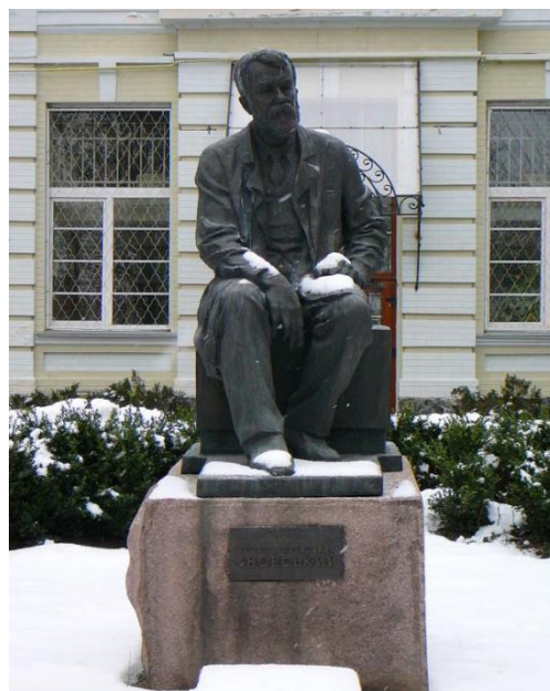
Рис. 3. Пам'ятник Ф. Яновському на території створеного ним Київського туберкульозного інституту (тепер – Національний Інститут фізіатрії та пульмонології, названий на його честь)

(джерело: https://oktv.ua/ua/turizm/dostoprimechatelnosti-kieva/ohmatdet )