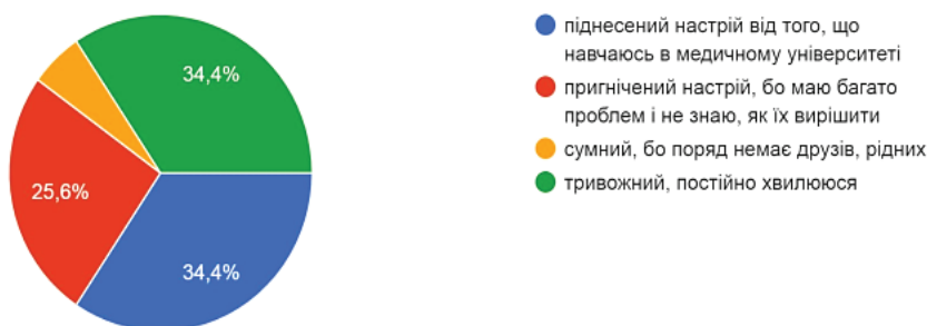
Рис. 1. Самооцінка психоемоційного стану студентами

Більше половини студентів (54,4 %) вказали, що найбільше проблем у них на момент опитування у сфері навчання, які в основному пов'язані з труднощами в самостійному опрацюванні великої кількості інформації, невмінням чітко висловлювати свої думки, невпевненістю і страхом виступати перед аудиторією (рис. 2 ).