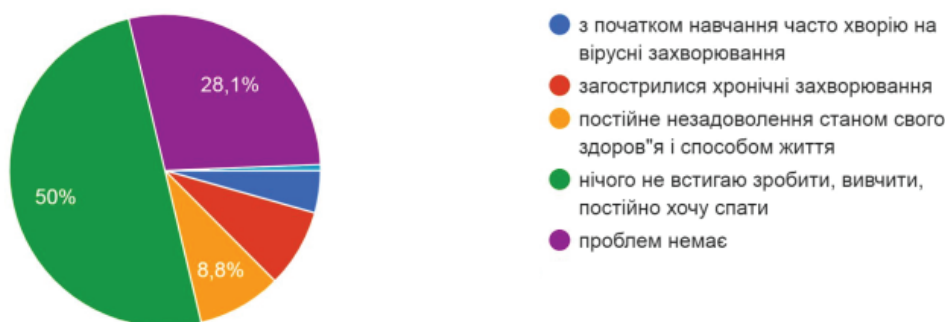
Рис. 3. Оцінка свого стану здоров'я студентами медичного факультету

Серед проблем зі здоров'ям 50 % студентів поскаржилися на хронічну втоми, слабкість, сонливість, у 8,1 % – загострилися хронічні захворювання, 8,8 % виражають постійне незадоволення станом свого здоров'я і способом життя, 4,4 % відмітили, що з початком навчання почали часто хворіти на вірусні інфекції (рис. 3).