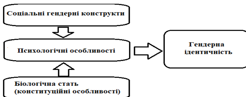
Рис. 2. Гендерна ідентичність у біопсихосоціальной системі координат