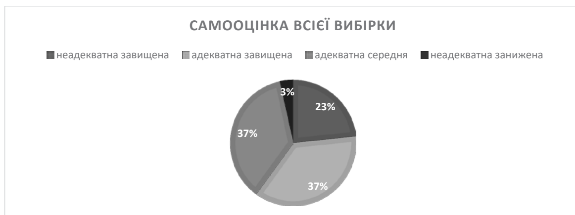
Діаграма 1. Рівень самооцінки всієї вибірки

За результатами дослідження виявлено, що у більшості досліджуваних присутній андрогінний тип гендеру, також більшість з респондентів має адекватно завищену самооцінку. Зведені результати проведеної діагностики самооцінки та гендерного типу надані в таблиці 1.