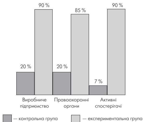
Рис. 3. Активність за підсумковим контролем в експериментальній та контрольній групах при проведенні рольової гри “Методи боротьби з тіньовою економікою”