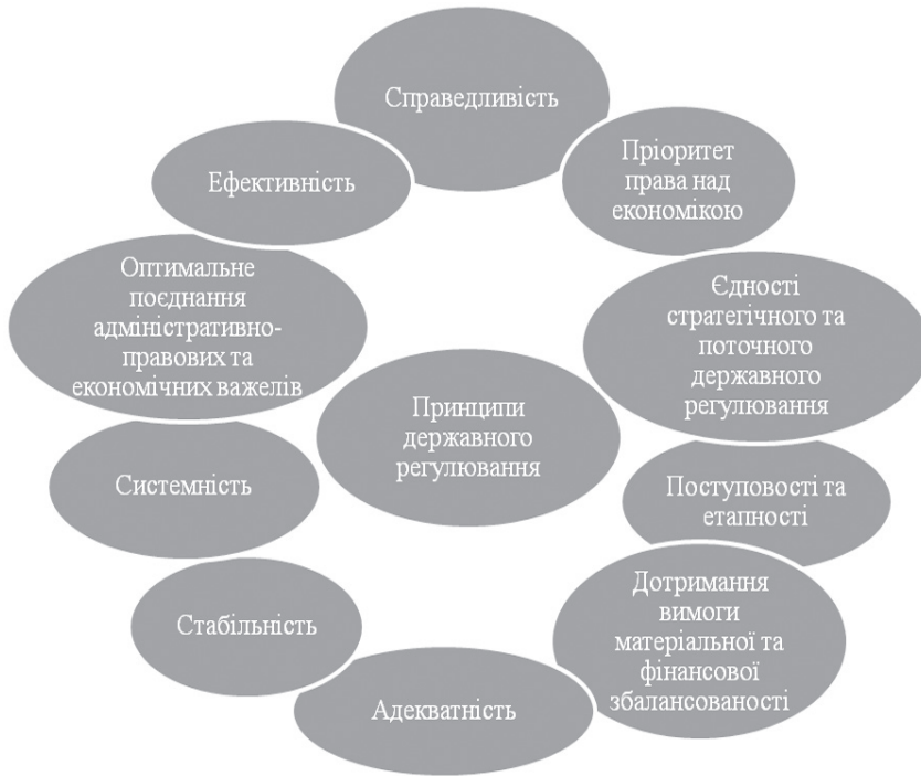
Рис. 1. Принципи державного регулювання Складено автором на основі джерела [7]

• системність — передбачає всебічний підхід до розв’язання економічних, соціальних, зовнішньоекономічних та інших завдань;